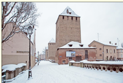
Les Ponts-couverts sous la neige en 2010.