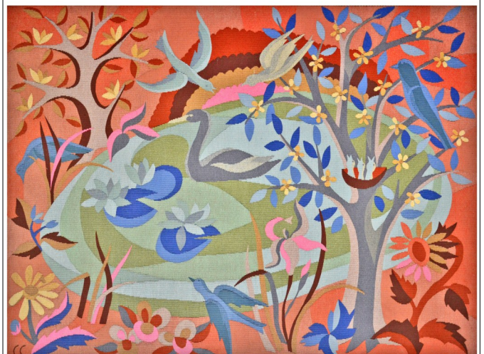
Tapisserie de Camille Clauss (1967) — Patrimoine des Hôpitaux Universitaires de Strasbourg.

Prix : 8 € sur inscription au secrétariat Groupe limité à 25 personnes